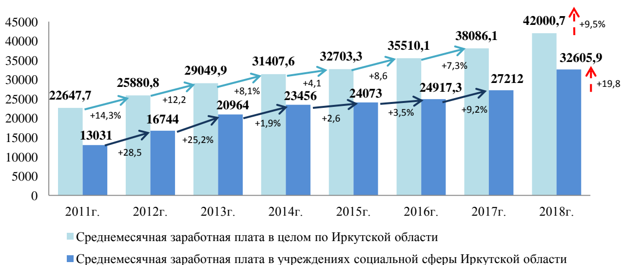
Рис. 3. Заработная плата в Иркутской области в целом по экономике и социальной сфере за 2011-2018 годы, руб.

Рост заработной платы в отраслях, где основную долю занимают учреждения социальной сферы (образование, здравоохранение, культура) за январь 2019 года отмечен в пределах 100,4-107,3% и главным образом обусловлен проводимой работой по повышению заработной платы в рамках исполнения «майских» указов Президента Российской Федерации от 2012 года и дифференциацией заработной платы работников государственных и муниципальных учреждений, проводимой в рамках совершенствования системы оплаты труда в Иркутской области.