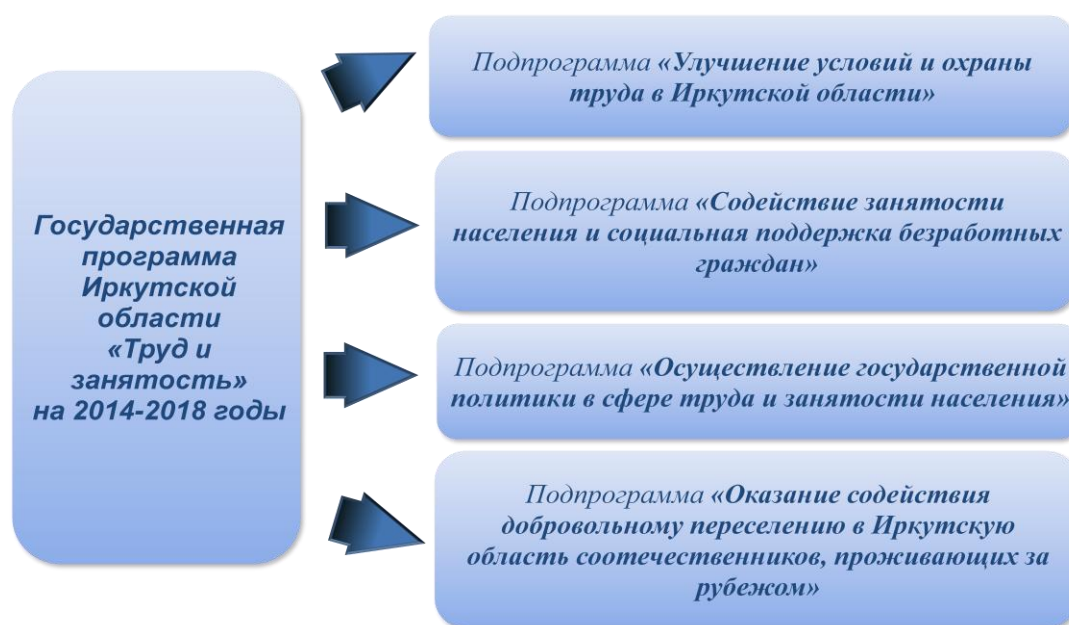
Рис. 1. Структура государственной программы

Исполнение целевых показателей государственной программы, по которым ведется ежеквартальный мониторинг (I квартал) представлено в таблице 1.