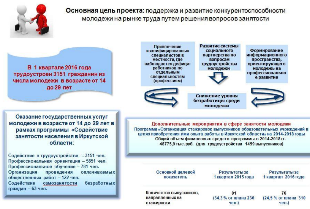
Рис. 2. проект «Работа - молодежи»

В рамках проекта «Работа - молодежи» в целях повышения конкурентоспособности на рынке труда для выпускников организаций, осуществляющих образовательную деятельность, организуются стажировки выпускников на предприятиях под руководством опытных наставников, что позволяет молодежи приобрести практический опыт работы по полученной специальности. В I квартале 2016 года трудоустроено на стажировку 76 выпускников организаций, осуществляющих образовательную деятельность (в I квартале 2015 года – 81 выпускник). Общая численность молодежи в возрасте от 14 до 29 лет, трудоустроенной в I квартале 2016 года, составила 3 151 чел. (в аналогичном периоде 2015 года – 4 108 чел.).