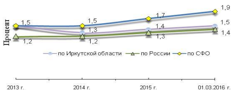
Рис. 5. Уровень зарегистрированной безработицы за 2013-2015 годы

По состоянию на 1 апреля 2016 года обратилось в органы занятости в целях поиска подходящей работы 20,4 тыс. граждан, что на 7,7% меньше, чем в аналогичном периоде 2015 года (22,1 тыс. чел.). Признано безработными 9,7 тыс. чел., что на 4% меньше, чем в аналогичном периоде 2015 года (10,1 тыс. чел.).