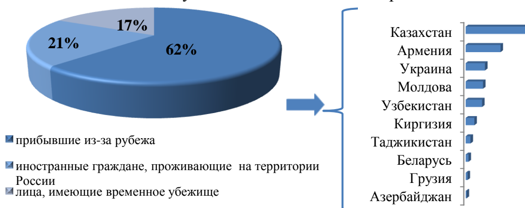
Рис. 4. Поступившие заявления в I квартале 2016 года

За I квартал 2016 года в уполномоченный орган поступили на рассмотрение 282 заявления от граждан, желающих принять участие в Государственной программе (в I квартале 2015 года – 718 заявлений).