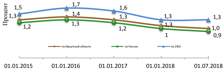
Рис. 2. Уровень зарегистрированной безработицы за 2015-2018 годы

На 1 июля 2018 года численность безработных составила 12 471 чел., что на 13,3% ниже значения показателя в аналогичном периоде 2017 года (14 382 чел.).