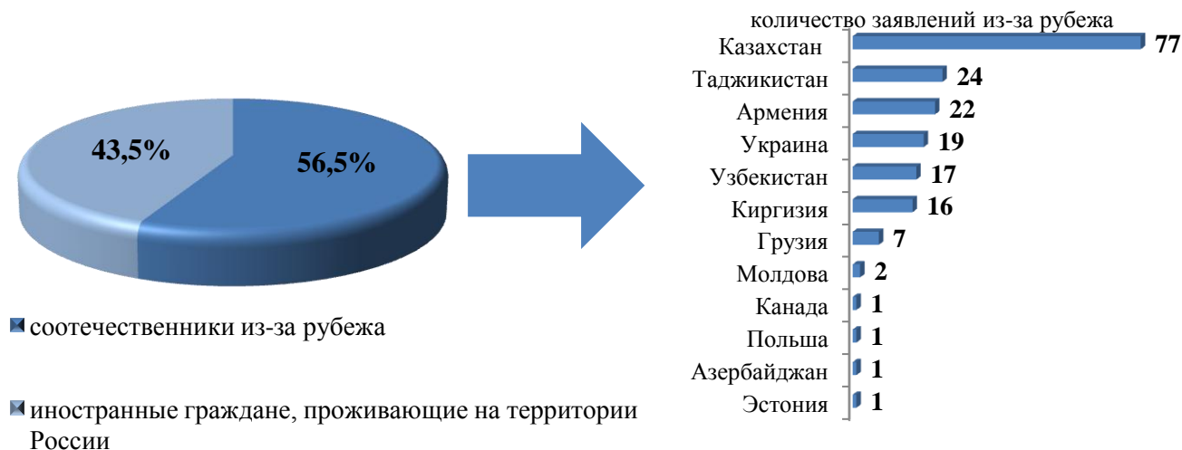
Рис. 1. Заявления, поступившие от граждан, желающих принять участие в Государственной программе переселения в 1 полугодии 2018 года

В части территориального распределения большая часть соотечественников желают переселиться в рамках Государственной программы переселения в города Иркутск, Ангарск, Братск, а также в Бодайбо, Усть-Илимск, Шелеховский, Иркутский районы и др.