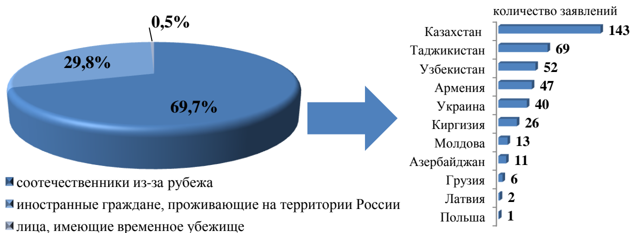
Рис. 1. Поступившие заявления от граждан, желающих принять участие в Государственной программе переселения в 2017 году

В части территориального распределения большая часть соотечественников желают переселиться в рамках Государственной программы переселения в города Иркутск, Ангарск, Братск, а также в Шелеховский, Иркутский районы, г. Бодайбо и Бодайбинский район.