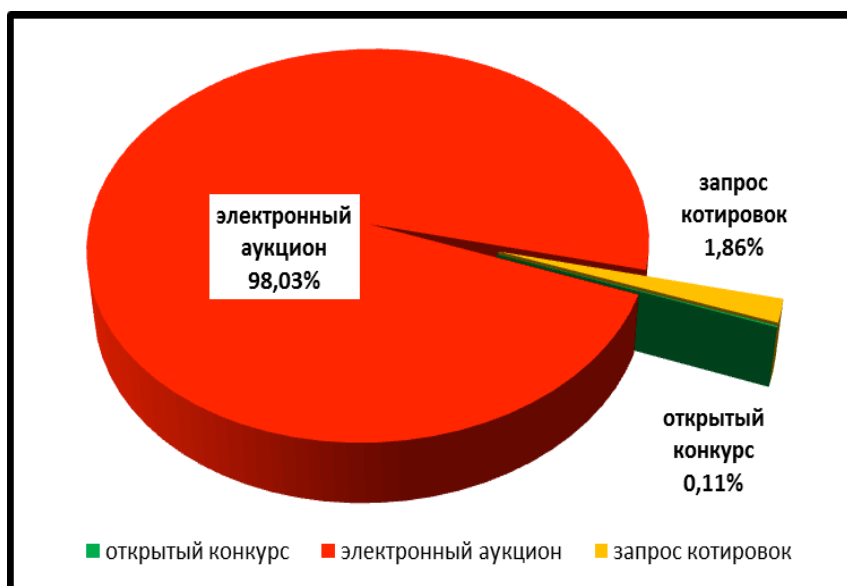
Распределение экономии по способам закупок, %

Условная экономия от проведенных процедур по определению поставщиков (исполнителей, подрядчиков) в 2014 году составила 15 %. Наибольшая экономия достигнута при проведении электронных аукционов.