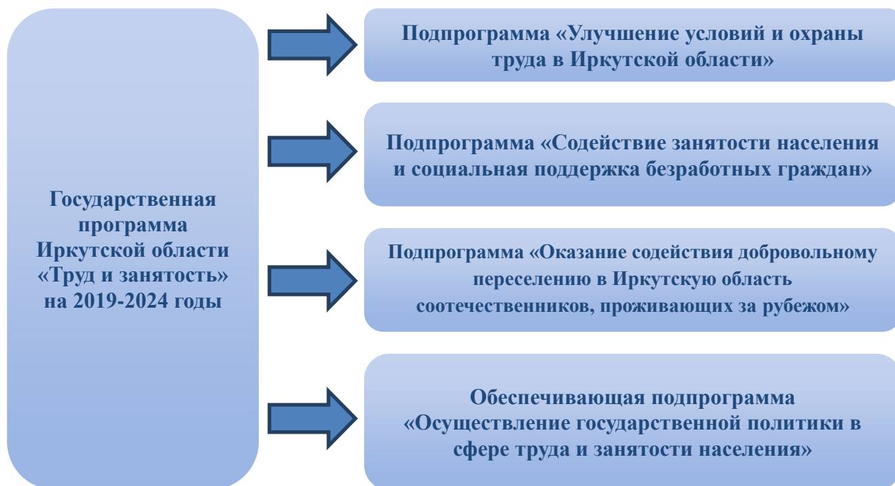
Рис. 1. Структура государственной программы

Государственная программа состоит из 4 подпрограмм (рисунок 1).