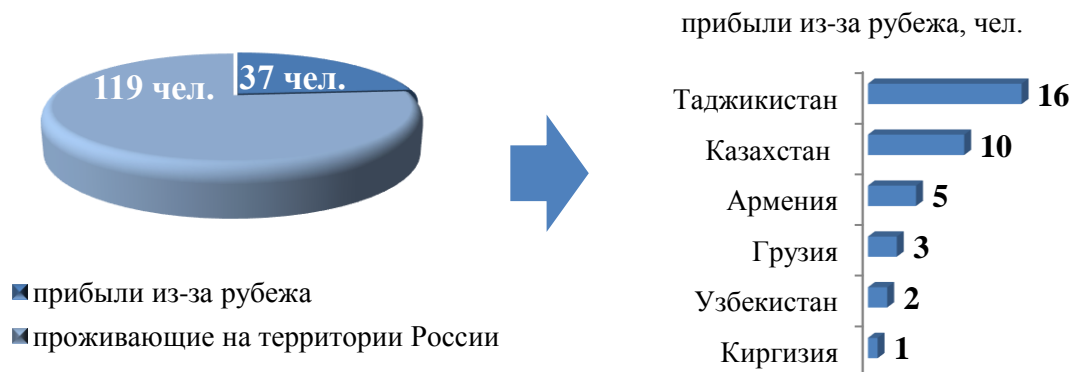
Рис. 1. Участники Государственной программы и члены их семей, прибывшие в Иркутскую область в 1 квартале 2021 года

проживающих на законном основании на территории Российской Федерации (76,3%).