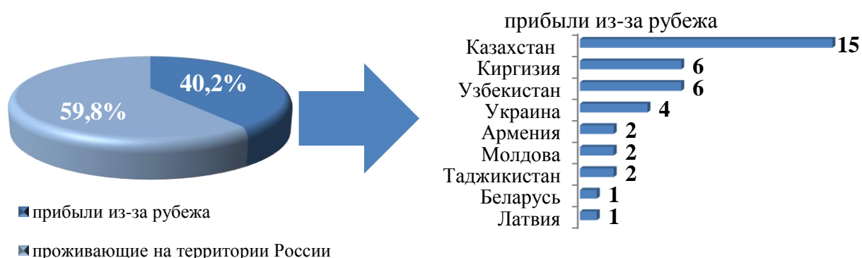
Рис. 4. Участники Государственной программы и члены их семей, прибывшие в Иркутскую область в 1 квартале 2020 года

Большая часть участников Государственной программы с членами семей для проживания выбрала города Иркутск, Братск, Ангарское городское муниципальное образование, есть переселившиеся в города Саянск, Бодайбо, Усть-Илимск, Зима, Шелеховский, Иркутский районы, Усть-Кутское муниципальное образование.