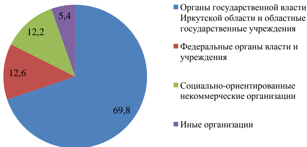
Распределение помещений, предоставленных на безвозмездной основе, между категориями пользователей, %

В связи с передачей субъектам Российской Федерации (в том числе Иркутской области) ряда государственных полномочий Российской Федерации, созданием новых ИОГВ Иркутской области и ОГУ для осуществления государственных полномочий спрос на нежилые помещения областной собственности значительно превышает возможности их предоставления. Данная ситуация усугубляется также высокой степенью изношенности фондов.