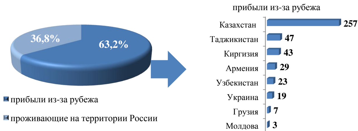
Рис. 4. Участники Государственной программы и члены их семей, прибывшие в Иркутскую область за 9 месяцев 2019 года

На реализацию мероприятий региональной программы переселения в 2019 году предусмотрено финансирование в объеме 3 421,8 тыс. руб., из них: областной бюджет – 814,8 тыс. руб., федеральный бюджет – 2 607,0 тыс. руб. Фактическое освоение средств за 9 месяцев 2019 года составило 2 144,3 тыс. руб. (62,7%), из них: областной бюджет – 479,6 тыс. руб. (58,9%), федеральный бюджет – 1 664,6 тыс. руб. (63,9%).