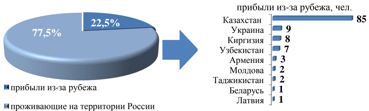
Рис. 4. Участники Государственной программы и члены их семей, прибывшие в Иркутскую область за 9 месяцев 2020 года

Большая часть участников Государственной программы с членами семей для проживания выбрала города Иркутск, Братск, Ангарское городское муниципальное образование, есть переселившиеся в города Бодайбо, Зима, Саянск, Свирск, Тулун, Усть-Илимск, Черемхово, Аларский, Боханский, Братский, Иркутский, Казачинско-Ленский, Куйтунский, Нижнеилимский, Слюдянский, Тайшетский, Черемховский, Чунский, Шелеховский, районы, Усть-Кутское муниципальное образование.