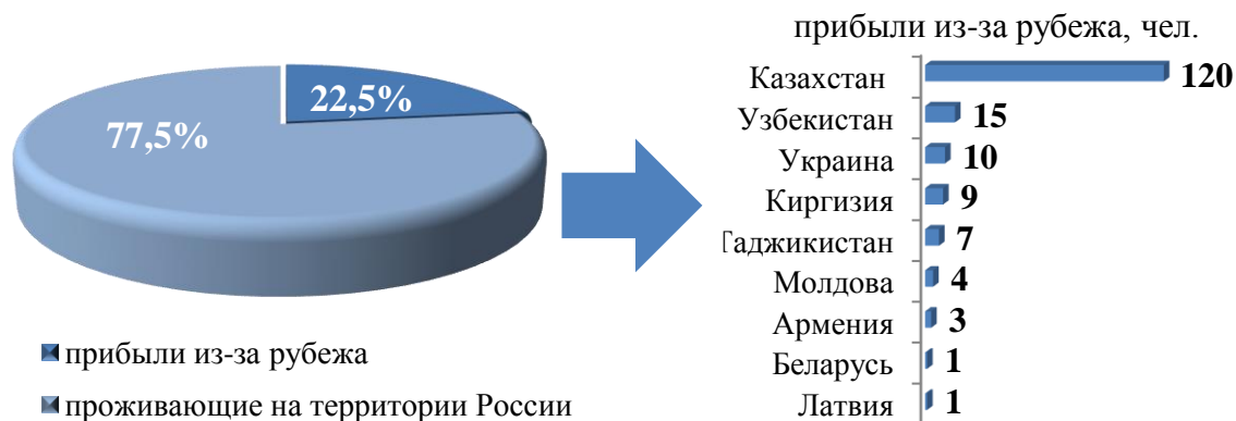
Рис. 4. Участники Государственной программы и члены их семей, прибывшие в Иркутскую область в 2020 году

Из-за рубежа прибыли 22,5% участников Государственной программы вместе с членами семей, большая часть которых из Республики Казахстан, Узбекистан, Украины, Киргизской Республики. Есть переселившиеся соотечественники и из Республик Таджикистан, Молдова, Армения, Беларусь, Латвийской Республики (рисунок 1). 77,5% иностранных граждан вместе с членами семей, временно проживающих на законном основании на территории Российской Федерации, получили и активировали свидетельство участника Государственной программы в Иркутской области.