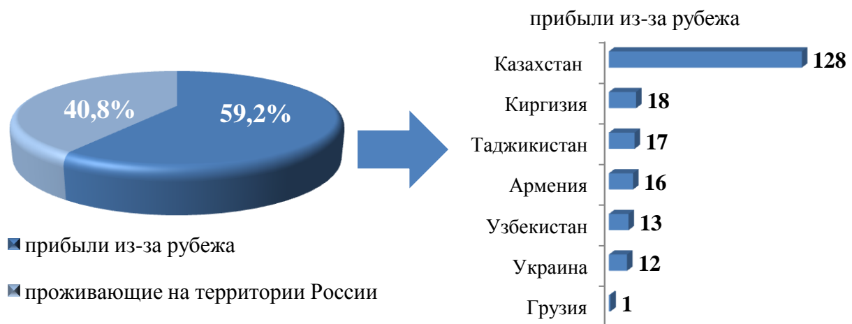
Рис. 3. Участники Государственной программы и члены их семей, прибывшие в Иркутскую область в первом полугодии 2019 года

муниципальное образование, Шелеховский, Иркутский районы, есть переселившиеся в города Бодайбо, Черемхово и др.