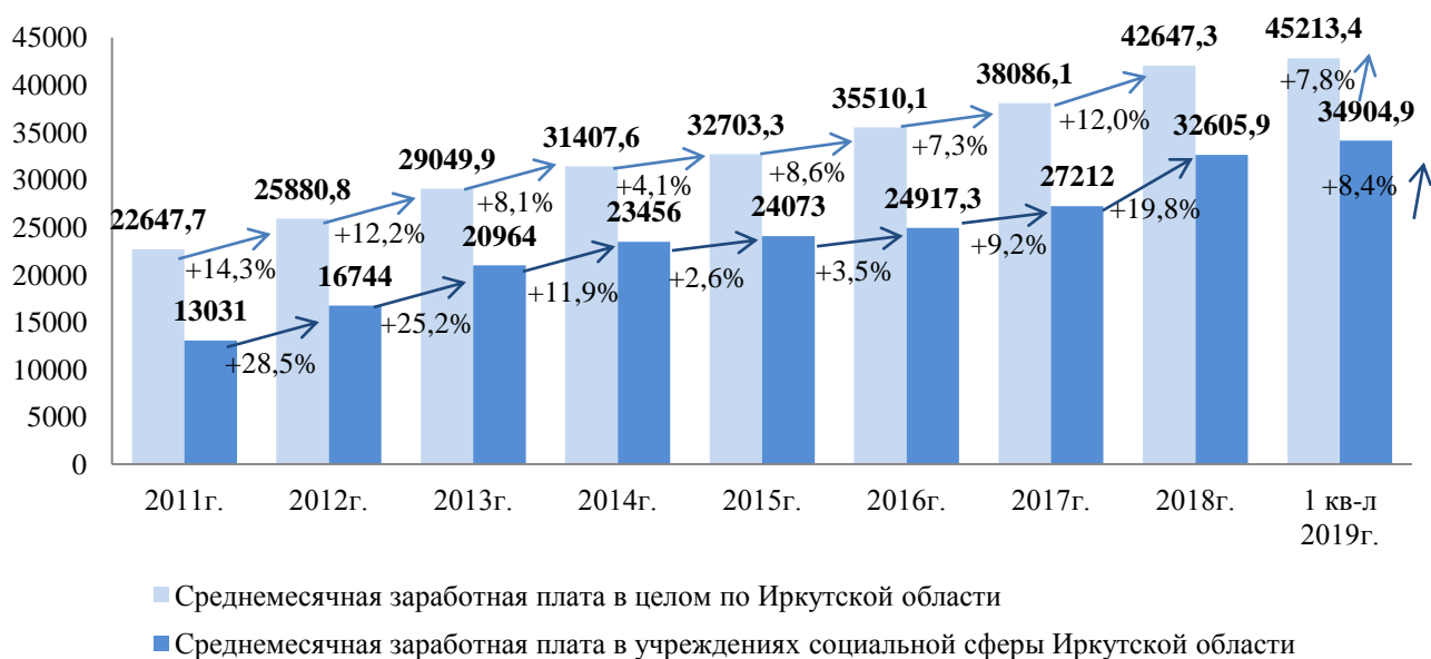
Рис. 3. Заработная плата в Иркутской области в целом по экономике и социальной сфере за 2011-1 пол-е 2019 годы, руб.

государственных и муниципальных учреждений региона, проводимой в рамках Указа Губернатора Иркутской области от 8 ноября 2018 года № 231-уг «О дифференциации заработной платы работников государственных и муниципальных учреждений в Иркутской области».