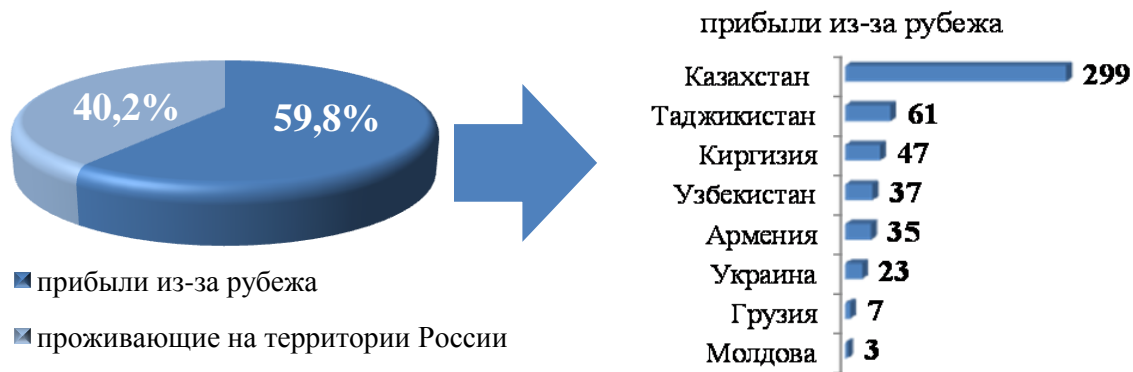
Рис. 4. Участники Государственной программы и члены их семей, прибывшие в Иркутскую область в 2019 году

Фактическое освоение средств на реализацию мероприятий региональной программы переселения за 2019 год составило 100% от запланированного объема финансирования.