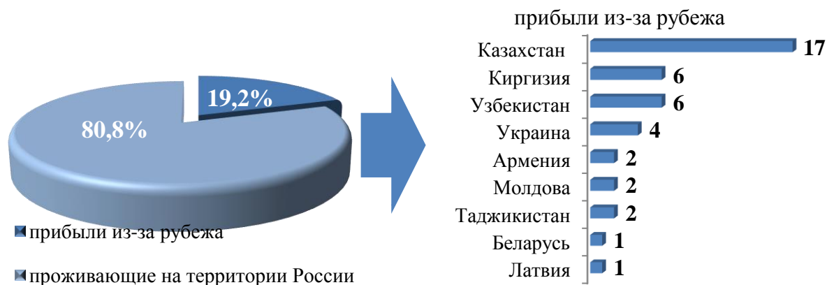
Рис. 4. Участники Государственной программы и члены их семей, прибывшие в Иркутскую область в 1 полугодии 2020 года

Большая часть участников Государственной программы с членами семей для проживания выбрала города Иркутск, Братск, Ангарское городское муниципальное образование, есть переселившиеся в города Бодайбо, Саянск, Усть-Илимск, Зима, Иркутский, Шелеховский, Нижнеилимский, Тайшетский, Чунский, Братский районы, Усть-Кутское муниципальное образование.