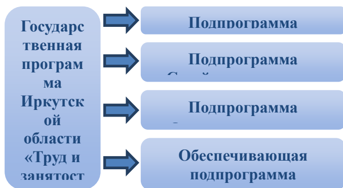
Рис. 1. Структура государственной программы

Государственная программа состоит из 4 подпрограмм (рисунок 1).