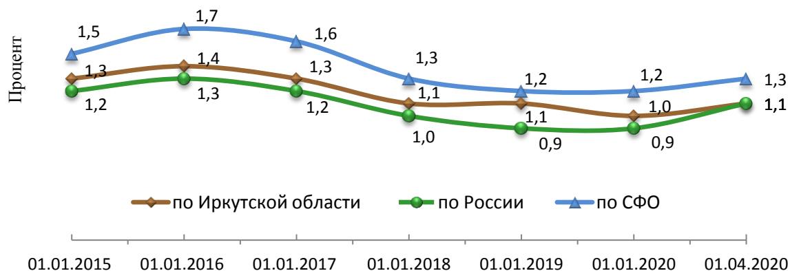
Рис. 2. Уровень регистрируемой безработицы

По состоянию на 1 июля 2020 года численность безработных составила 42,7 тыс. чел., что на 209% выше значения показателя в аналогичном периоде 2019 года (13,8 тыс. чел.).