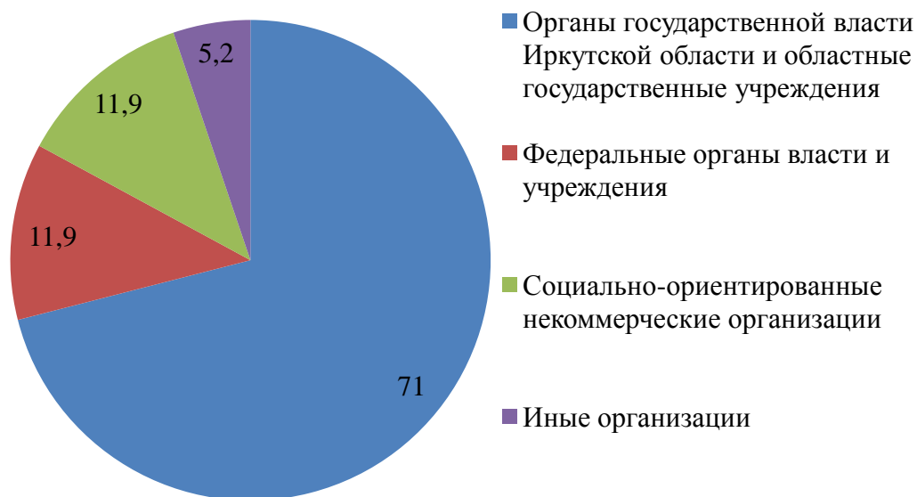
Распределение помещений, предоставленных на безвозмездной основе, между категориями пользователей, %

В связи с передачей субъектам Российской Федерации (в том числе Иркутской области) ряда государственных полномочий Российской Федерации, созданием новых ИОГВ Иркутской области и ОГУ для осуществления государственных полномочий спрос на нежилые помещения областной собственности значительно превышает возможности их предоставления. Данная ситуация усугубляется также высокой степенью изношенности фондов.